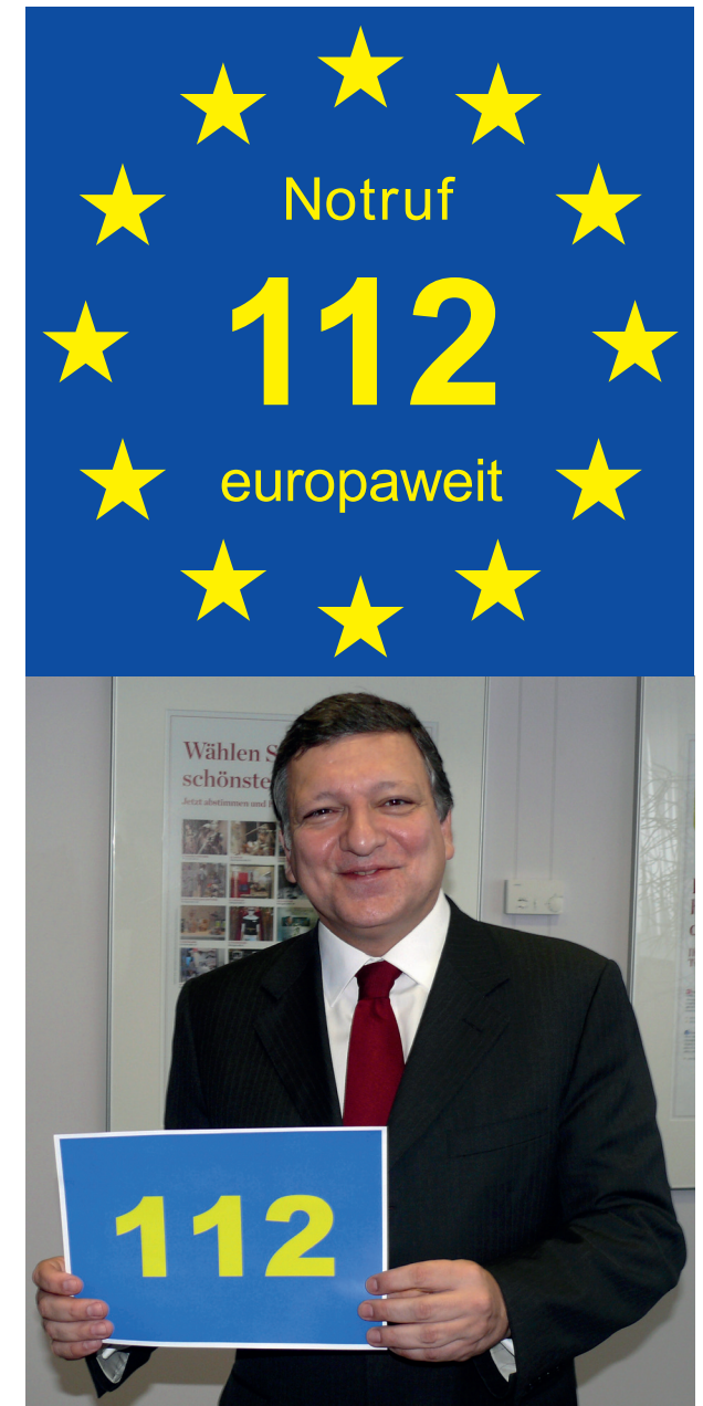
EU-Kommissionspräsident José Manuel Barroso in Stuttgart, Januar 2011.

Europäisches Informationszentrum im Regierungspräsidium Darmstadt Luisenplatz 2 64283 Darmstadt Tel.: +49 (6151) 12 5659 Fax: +49 (6151) 12 4390 E-Mail: eu-infozentrum@rpda.hessen.de Internet: www.rp-darmstadt.hessen.de www.eiz.hessen.de