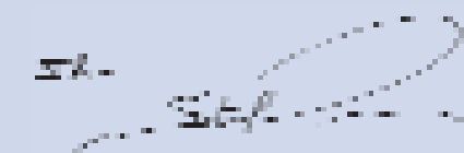
Stefan Mappus MdL Vorsitzender der CDU-Fraktion im Landtag von Baden-Württemberg